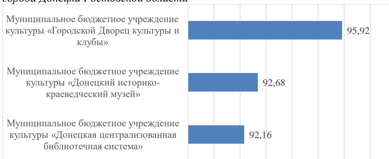
Гистограмма 1. Рейтинг по результатам сбора, обобщения и анализа информации о качестве условий оказания услуг организациями культуры города Донецка Ростовской области